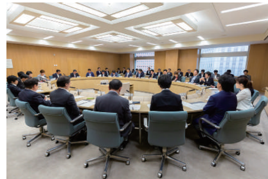
議会運営委員会室